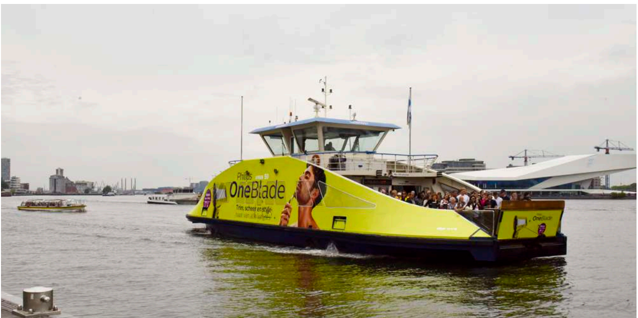
Pont - Philips